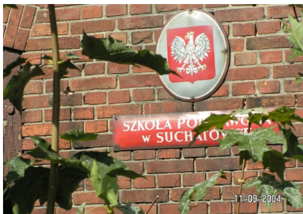
Fot 6. Obecnie w budynku zabytkowej szkoły mieszczą się mieszkania prywatne

wydziałowa, składająca się z siedmiu klas. Uczyły się w niej zarówno dzieci polskie, jak i niemieckie (wyjątek stanowiły lekcje religii, na które dzieci te uczęszczały osobno).