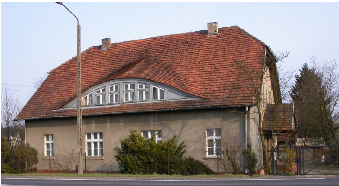
Fot 9 Dawny budynek SS w czasie II wojny światowej; obecnie własność prywatna