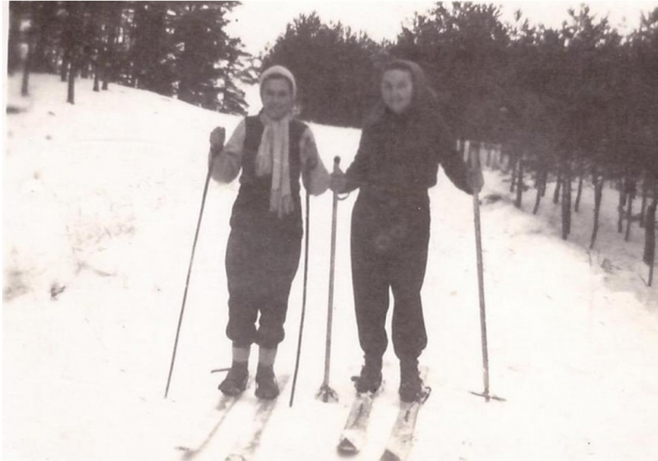
Fot 15. Zimy pełne śniegu i leśne pagórki

powalały dawniej na uprawianie narciarstwa