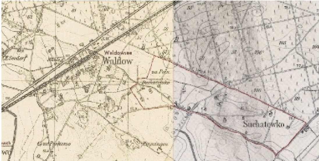
Fot 3. Z lewej Waldow (Deutsch Suchatowko) i z prawej- Suchatowko (Polnisch Suchatowko)

Podział na dwie części wsi zarysowywał się wyraźnie już w czasach zaboru pruskiego, kiedy to Słownik geograficzny Królestwa Polskiego wydany na przełomie XIX i XX wieku odnotowuje nazwę wsi, Polnisch Suchatowko o b o k Deutsch Suchotowko , co potwierdzają także niemieckie mapy topograficzne z 1940 i 1944 roku. Ta pierwsza część - Polnisch Suchatowko - nazywana była w dwudziestoleciu międzywojennym Suchowicami (przestały one istnieć od czasu powstania podczas II wojny światowej na tym terenie poligonu w ramach okręgu wojennego Posen, a o dawnych zabudowaniach świadczą dziś już tylko rosnące na tamtych terenach kępy bżów). Drugą natomiast część, niemal dwa razy liczniejszą pod koniec XIX wieku od pierwszej - Deutsch Suchotowko nazywano także z racji leśnych terenów Waldow , a w czasie okupacji hitlerowskiej Waldowsee . Dzisiejsza Suchatówka zajmuje zasadniczo tereny tej właśnie "niemieckiej" części.