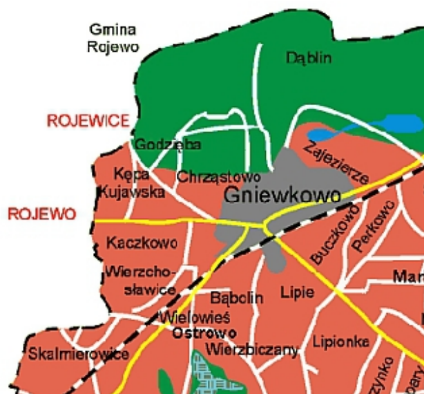
Fot 1 Położenie Suchatówki innych miejscowości w gminie Gniewkowo

Miejscowość Suchatówka zajmuje powierzchnię 2,6 km Zamieszkuje ją 513 (dane na sierpień r.) Przez ostatnie 8 lat p r z y b y ł o w Suchatówce 15 osób